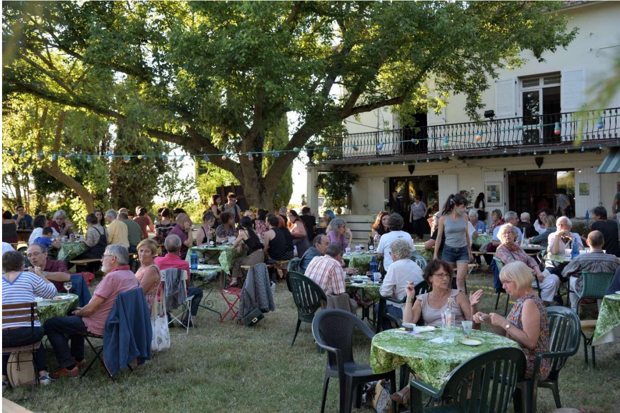
Accueil du public local lors de spectacles