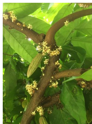
Cacaoyer en fleur avec 1 cabosse