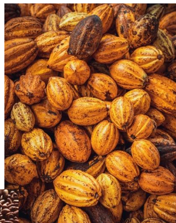
Cabosses mures contenant les fèves