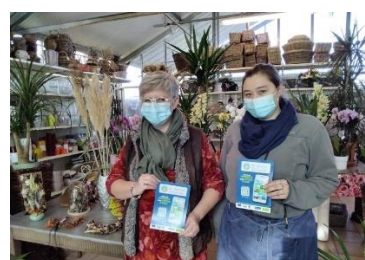
Des commerçants adhérant au réseau