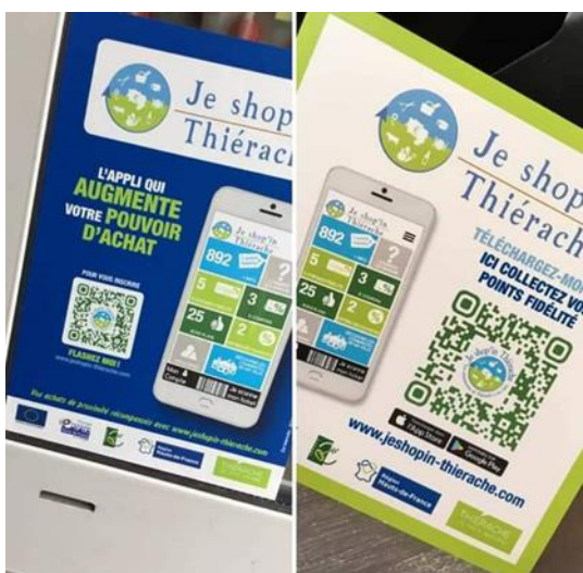
Signalétique apposée sur les vitrines des commerçants partenaires