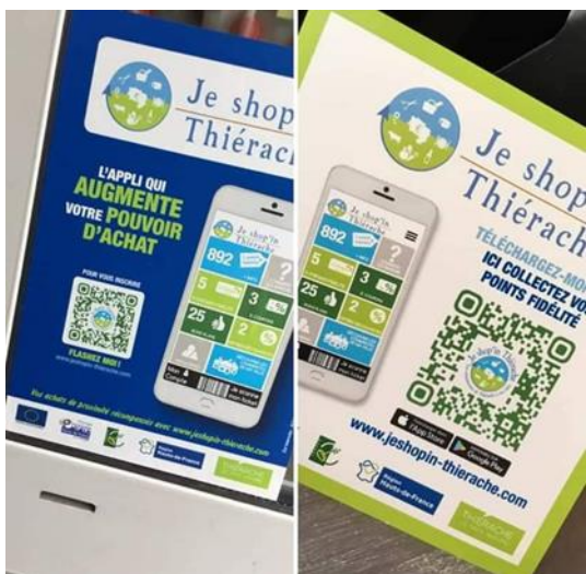
Signalétique apposée sur les vitrines des commerçants partenaires