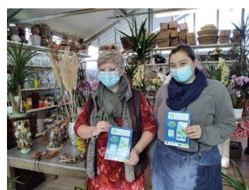
Des commerçants adhérant au réseau