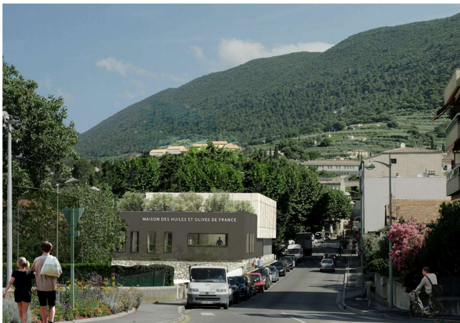
Maison des Huiles et Olives de France 07 Vue depuis le port de l'Europe Scale 1:100 Date 2024/04/10 Author LEADER Client Mairie de Ploec-sur-Lié Project Maison des Huiles et Olives de France Address 148-150-152 Avenue de la Libération - 56100 Ploec-sur-Lié Phone 02 97 82 00 00 Email contact@leader.fr