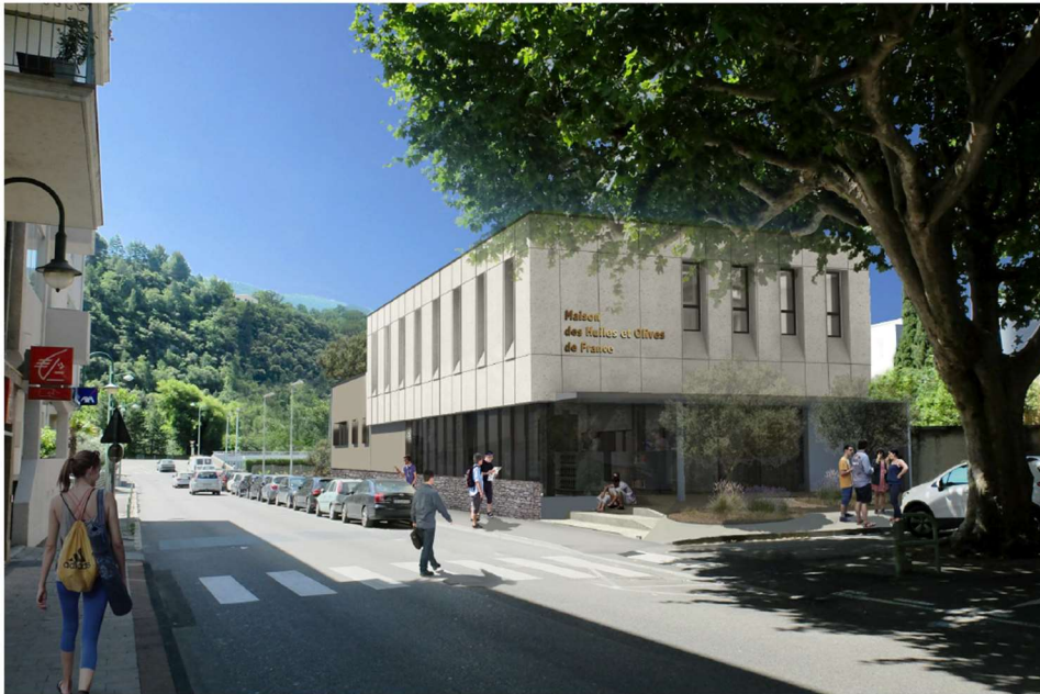
Maison des Huiles et Olives de France 06 Vue depuis place de la Libération Scale 1:100 Date 2024/04/10 Author LEADER Client Mairie de Ploec-sur-Lié Project Maison des Huiles et Olives de France Address 148-150-152 Avenue de la Libération - 56100 Ploec-sur-Lié Phone 02 97 82 00 00 Email contact@leader.fr

Insérer quelques photos ou illustrations du projet.