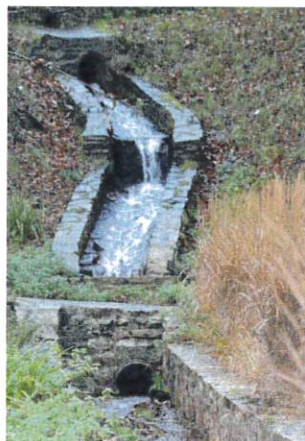
Une des fontaines et rigoles du Village